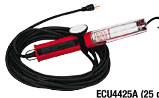
ECU4425A (25 футов) ECU4450A (50 футов)