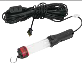
ECU350BK (50 футов) ECU325BK (25 футов)